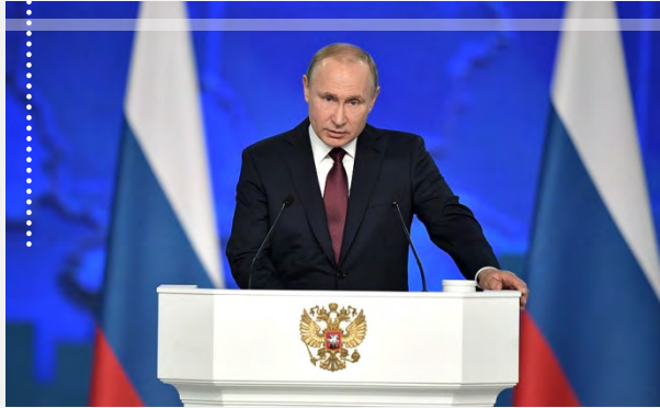
Послание Президента России В.В.Путина Федеральному Собранию 2019 год