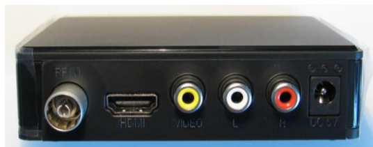
Фото 1. Цифровая приставка (ресивер, тюнер)

Если у гражданина старый телевизор (произведенный до 2012 года), в котором нет встроенного тюнера с поддержкой формата DVB-T2, то для просмотра телевизора нужно покупать отдельную приставку (см. фото 1), которая будет принимать сигнал DVB-T2, обрабатывать его и передавать на телевизор готовую картинку. Саму приставку можно подключить практически к любому телевизору.