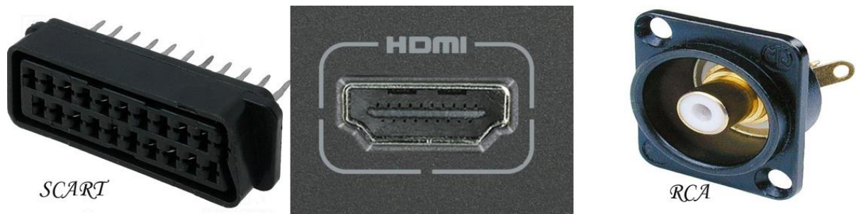
Фото 3. Типы телевизионных разъемов

На фото 4 представлена схема подключения, при использовании которой с 3 июня 2019 года изображение на телевизорах будет отсутствовать.