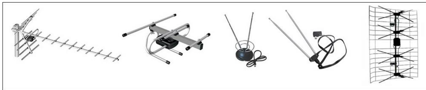
Фото 2. Антенны для приема цифрового сигнала

К приставке подключается антенна. Специальная антенна для этого не нужна. Возможно использование той антенны, которая была установлена для просмотра аналогового телевидения. Также будет работать любая дециметровая антенна. Так называемая "польская антенна" так же подойдет (см. фото 2).